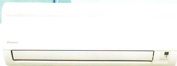
FTYN-GX típusú beltéri egység